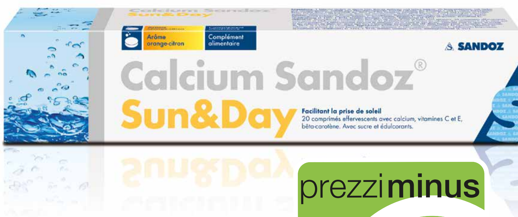
Calcium Sandoz® Sun&Day 20 compresse eff.