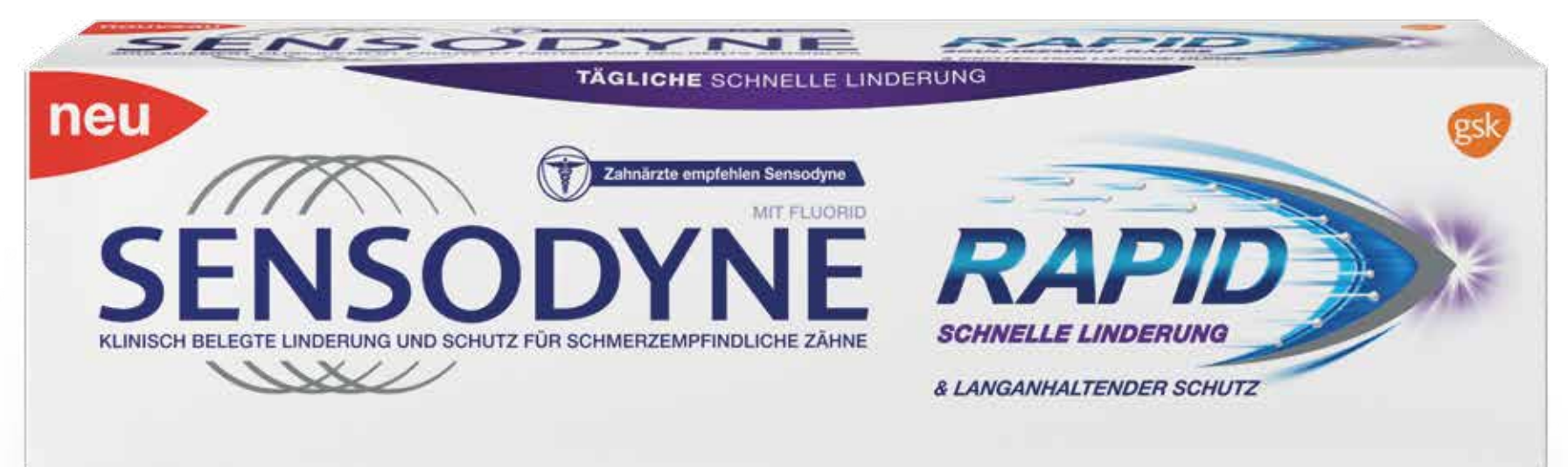
Sensodyne® Rapid 75 ml