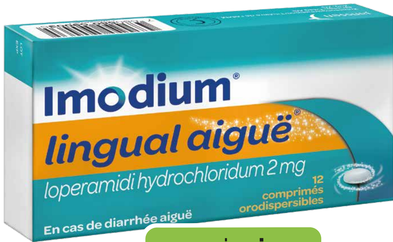
Imodium® lingual diarrea acuta 2 mg 12 compresse