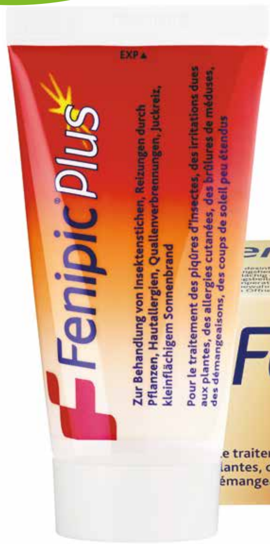
Fenipic® Plus Gel Tube 24 g