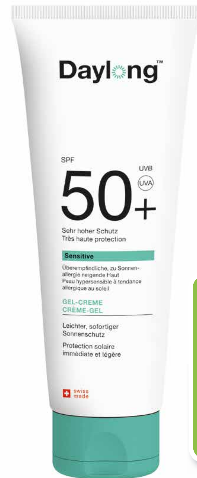
Daylong® sensitive Gel-Crème SPF 50+ 200 ml